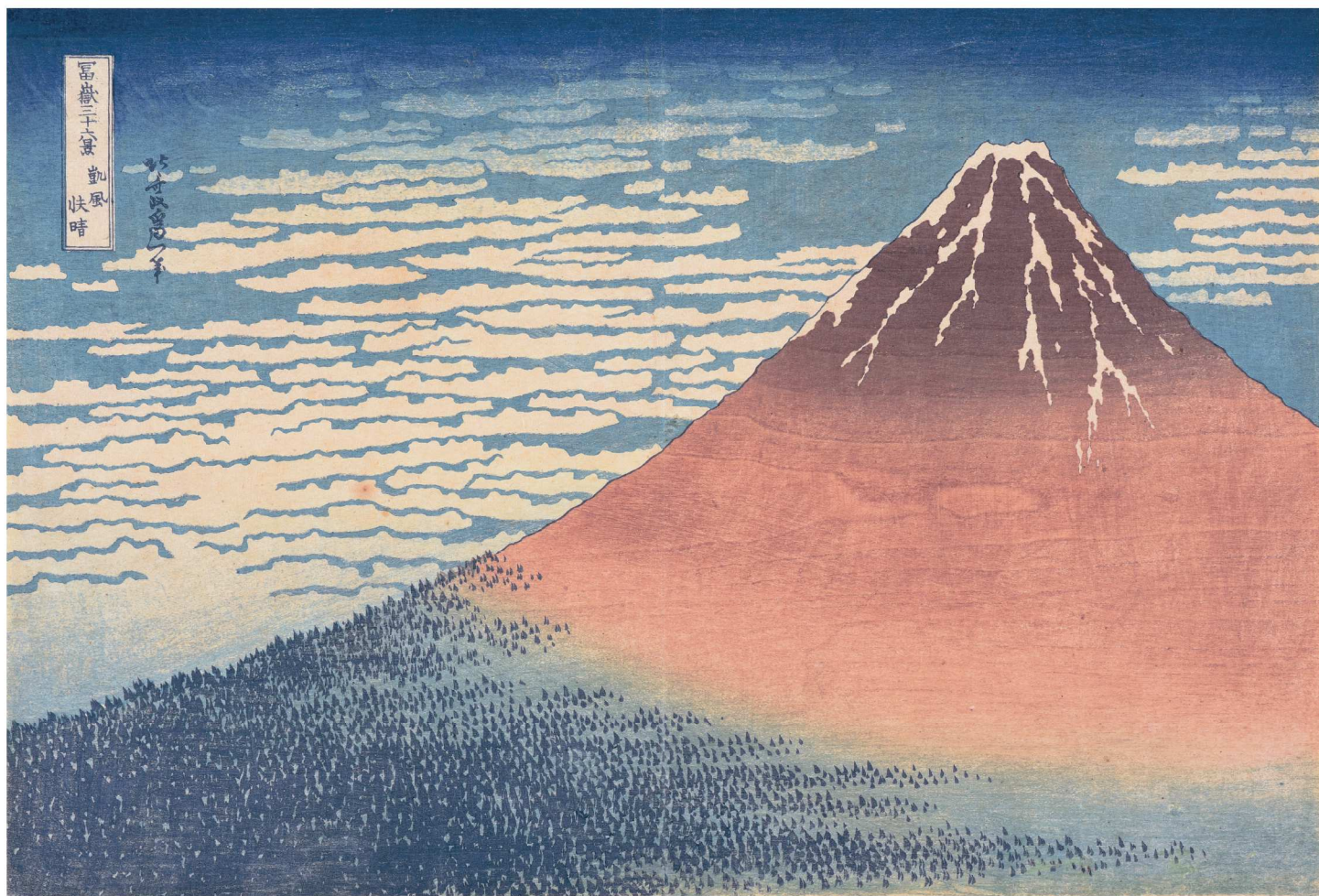
葛飾北斎「富嶽三十六景 凱風快晴」島根県立美術館蔵【島根県指定文化財】