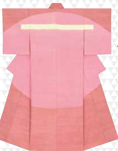
【染織】細織着物「入り日」 村上良子[人間国宝]