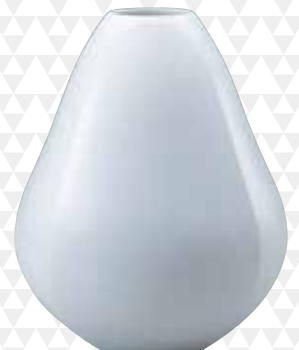
【陶芸】白塗面取壺 前田昭博[人間国宝](鳥取市)