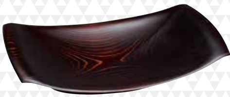
【木竹工】杉片身砂磨盛器 藤寄一正