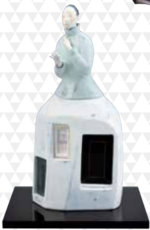
【人形】桐壺胡粉「たそがれ」 春木均夫