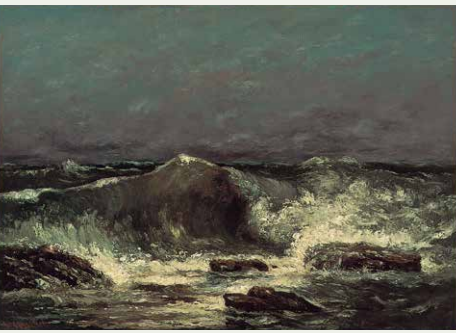
ギュスターヴ・クールベ《波》1869年