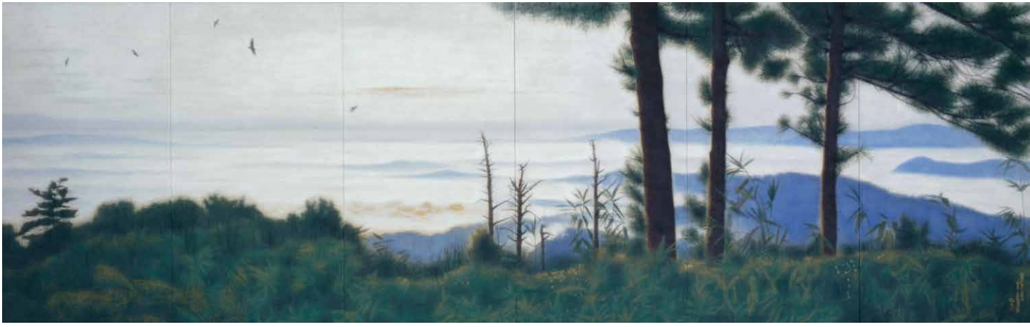
平山郁夫《八雲立つ 出雲路古代幻想》1998年