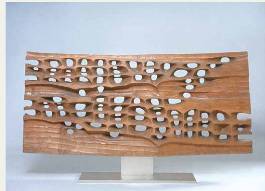
豊福知徳《構成I》1961（昭和36）年