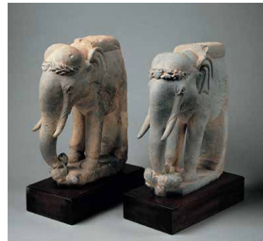
《象》パキスタン 2-3世紀