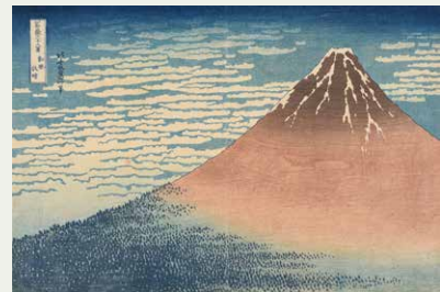
葛飾北斎《富嶽三十六景 乳風快晴》(新庄コレクション) 天保初期(1830~34)頃[第10期展示]

コレクション展示室2(「北斎展示室」)では、当館が誇る北斎コレクション・約1,600件の中から、北斎の錦絵・摺物・版本・肉筆画、約40点をいつでもご覧いただけます。