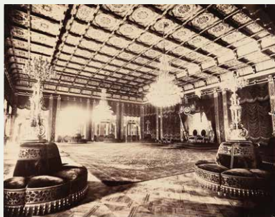
亀井茲明《明治宮殿》1894(明治27)年

1995年に島根県立美術館の建設室が開設されてから30年が経とうとしています。今、美術館のコレクション総数の3分の1を超える写真コレクション。この30年を振り返ります。