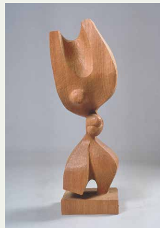
植木茂《絆(きずな)》1978(昭和53)年