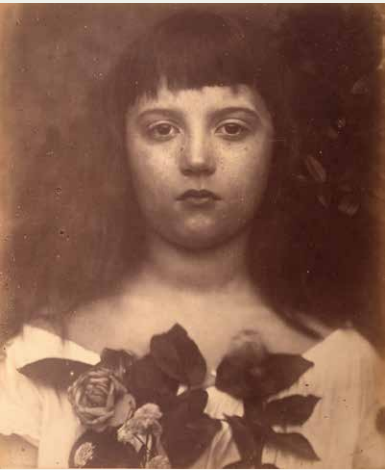
ジュリア・マーガレット・キャメロン《フロレンス》1872年