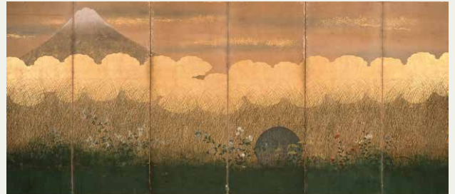
《武蔵野図》(左隻)、江戸時代中期

当館が所蔵する江戸時代の近世絵画、近代以降の日本画より、特に当館が誇る優品、島根県出身や来遊画家の作品など、島根ゆかりの美術を紹介します。