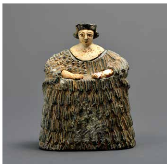
《女神像》アフガニスタン 前2000年頃