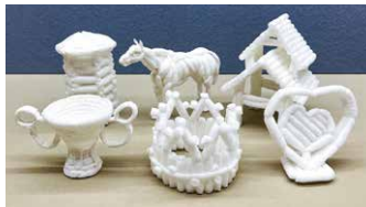
※「ももこオアシス」作品イメージ

砂漠の中で水が湧く「オアシス」には、緑が育ち人々がくらしめます。いきものやたてももの、たからものなど、あなただけのオアシスのまを、天然由来のふわふわ素材を使って自由につくってみよう。