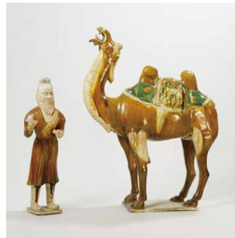
《駱駝・牽駝胡人俑》中国 8世紀