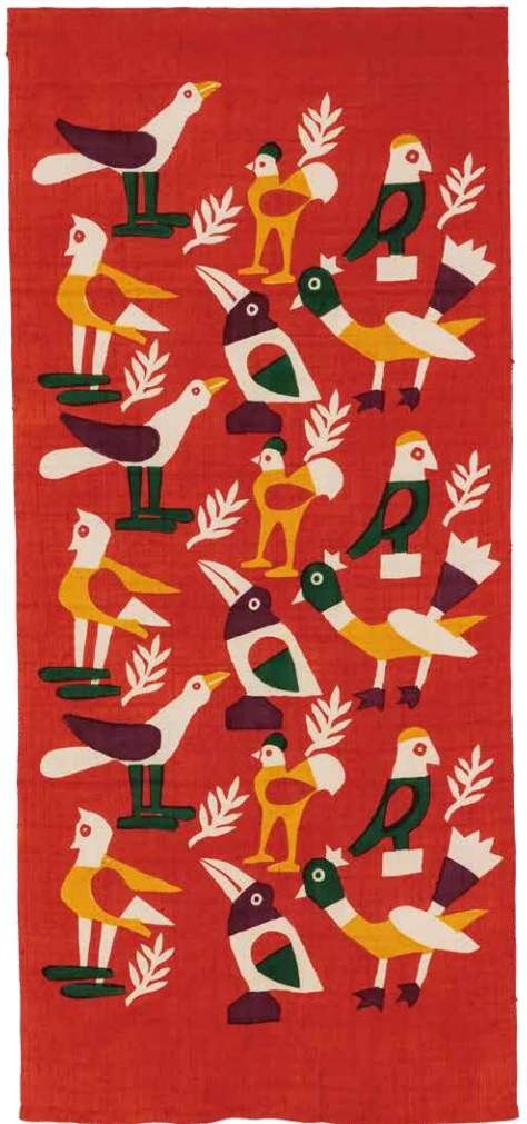
柚木沙弥郎<小鳥>1992(平成4)年 坂本善三美術館蔵

本展では、代表作と資料300点により作家の長年にわたる多彩な活動を概観するとともに、最晩年の仕事となる新作もご紹介します。また島根をはじめとする、作家とゆかりの深い国内外の各都市をテーマにした特別展示も行います。柚木沙弥郎が作り上げた豊かな色彩と模様の世界をお楽しみください。