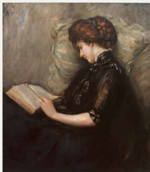
石橋和訓《美人読詩》1906(明治39)年

石橋和訓や木村義男など本県出身の画家から、小泉清(小泉八雲・セツの三男)や松本竣介(妻の郷里・松江に眠る)など家族のつながりで島根にゆかりのある画家たちまで、当館コレクションにより紹介します。