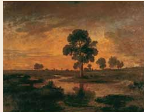
テオドール・ルソー《樹のある風景》制作年不詳、山梨県立美術館