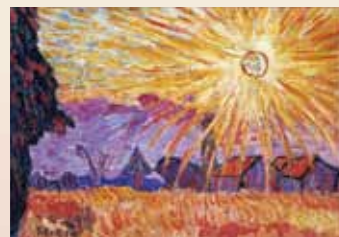
萬鉄五郎《太陽の麦畑》1913年頃、東京国立近代美術館