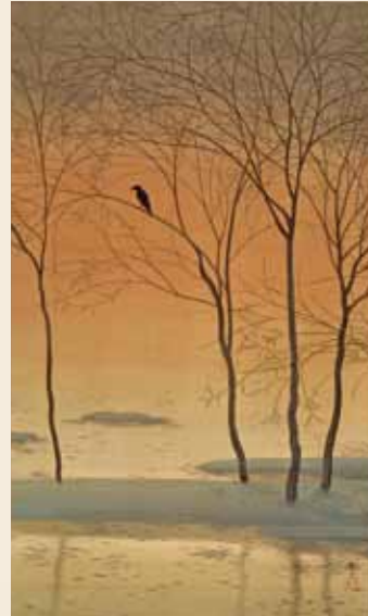
菱田春草《暮色》1901年、京都国立博物館【展示期間】9/4-9/16