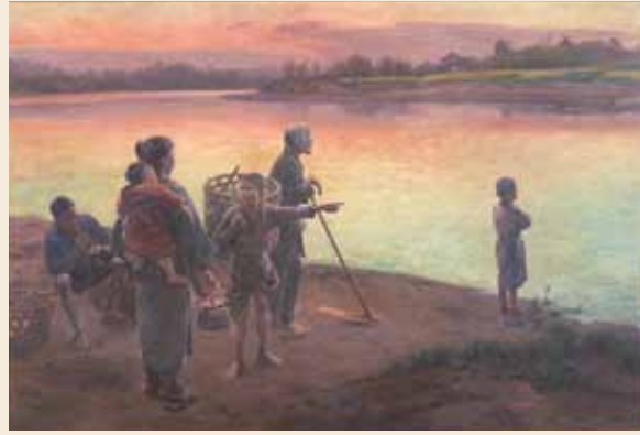
和田英作《渡頭の夕暮》1897年、東京藝術大学