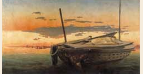
高橋由一《芝浦夕陽》1877年、金刀比羅宮