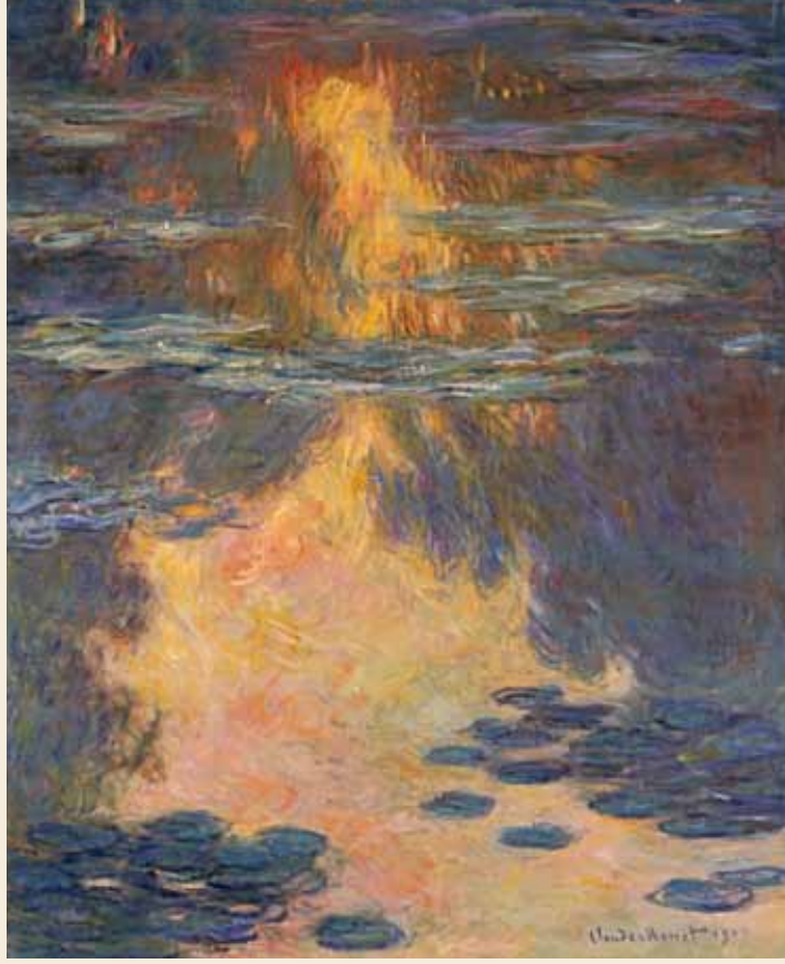
クロード・モネ《睡蓮》1907年、和泉市久保惣記念美術館【前期展示】9/4-10/7