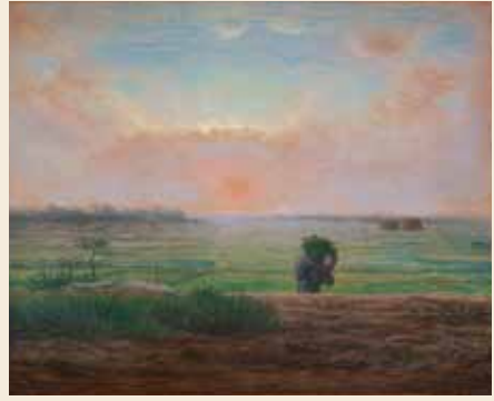
ジャン＝フランソワ・ミレー《夕陽》1867年頃、ひろしま美術館【後期展示】10/9-11/4