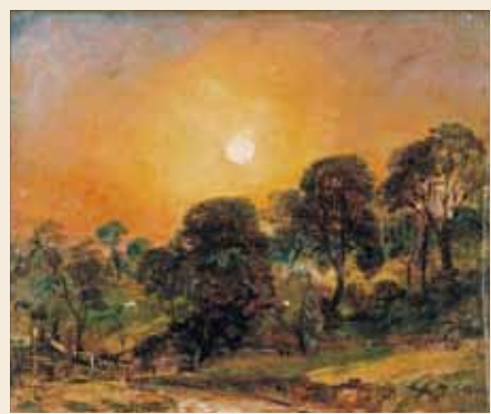
ジョン・コンスタブル《ハムステッド・ヒースの木立、日没》1821年、静岡県立美術館【展示期間】9/4-9/9