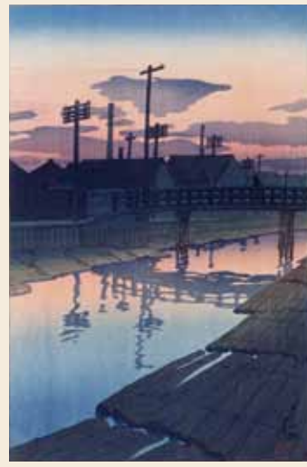
川瀬巴水《東京十二題 木場の夕暮》1920年、島根県立美術館【前期展示】9/4-10/7