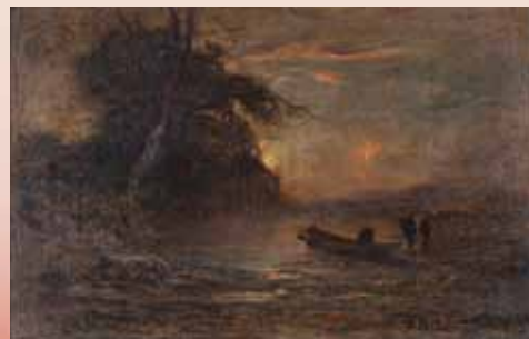
アントニオ・フォンタネージ《沼の落日》1876-78年頃、三重県立美術館