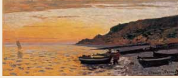
クロード・モネ《サン＝アドレスの海岸》1864年、栃木県立美術館