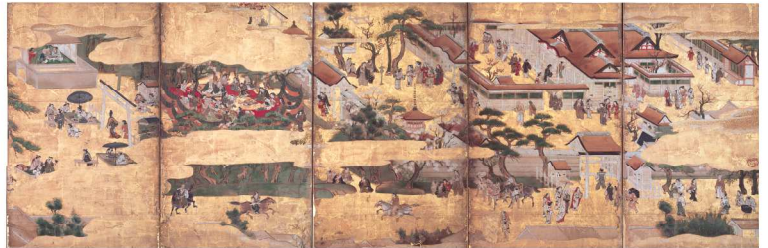
「棕政」印《北野社頭図屏風》江戸前期