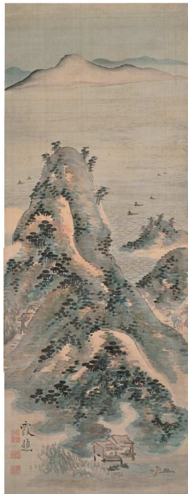
池大雅《児島湾真景図》江戸中期