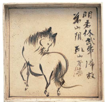
尾形乾山《鑄絵馬図角皿》江戸中期