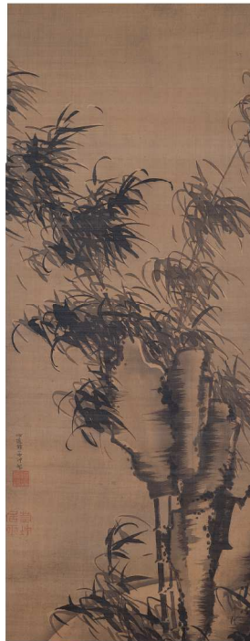
伊藤若冲《風竹図》江戸中期