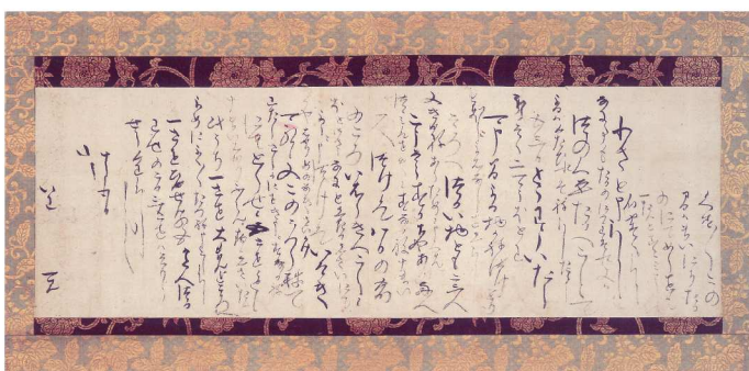
【重要美術品】豊田秀吉《豊田秀吉自筆書状(いわ宛)》天正16(1588)年