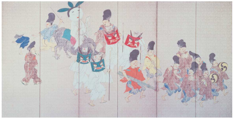
浮田一蕙《やすらい祭・牛祭図屏風》(左隻) 江戸後期 (左右隻を半期ずつ展示)