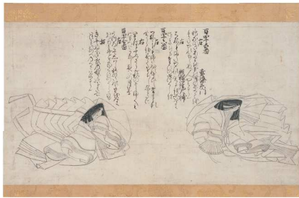
《時代不同歌合絵巻 断簡》鎌倉末期(展示期間:9/18~10/12)