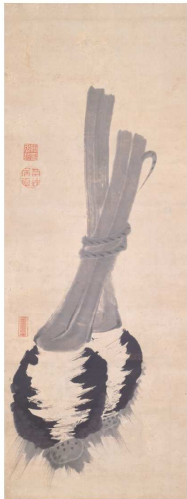
伊藤若冲《里芋図》江戸中期