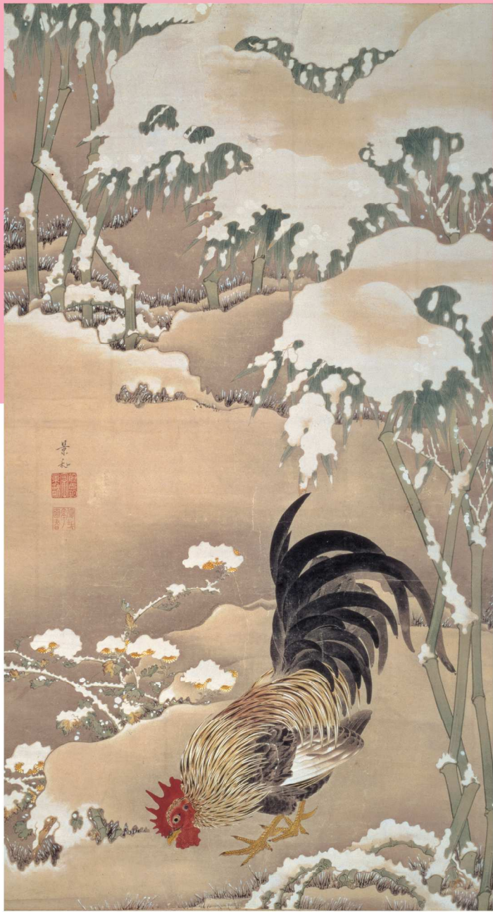
伊藤若冲《雪中雄鶏図》江戸中期（展示期間：10/14～11/3）

細見美術館(京都市)は、江戸時代を代表する画家・伊藤若冲(1716-1800)の絵画を数多く収蔵し、その内容の豊かさから、内外屈指の若冲コレクションとして広く知られています。本展では、15点の若冲画を中心に、円山応挙・池大雅ら個性豊かな京の画家たちの絵画、華やかな京の姿を映す遊楽図や祭礼図、古典文学を題材とした物語絵や歌仙絵、そして茶の湯の美術など、「京」の面影を今に伝える古美術94点を一堂に展示します。奇才若冲を生み育んだ、伝統と革新が織りなす「京」の美意識を感じていただけます。