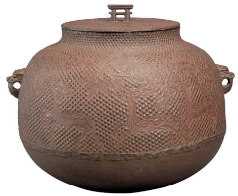
【重要文化財】「芦屋敷地楓鹿図真形釜」室町時代