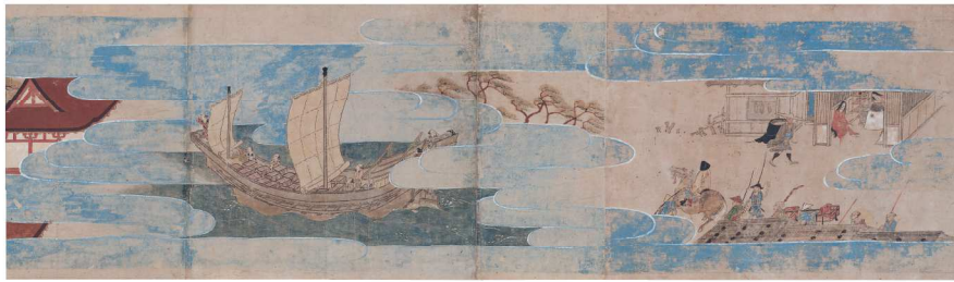
【重要文化財】《山王靈験記絵巻》(部分) 室町時代(半期で巻き替え)