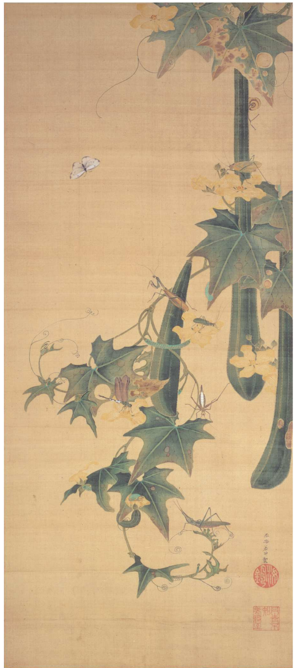
伊藤若冲《糸瓜群虫図》江戸中期(展示期間:9/18~10/12)

※作品はいずれも細見美術館蔵 ※下部鼠の図は伊藤若冲《鼠婚礼図》(部分) 寛政8(1796)年