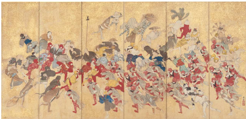
小澤華嶽《ちょうちょう踊り図屏風》江戸後期