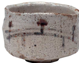
《志野茶碗 銘「弁慶」》桃山時代