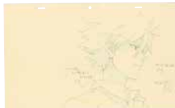
「：Q」C-0794 C-0808 C-0815 修正原画