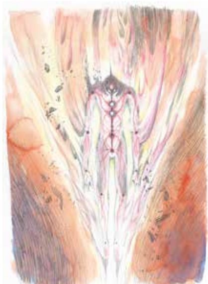
エヴァ疑似シン化第2形態（通称 光の巨人） イメージボード兼設定 決定稿