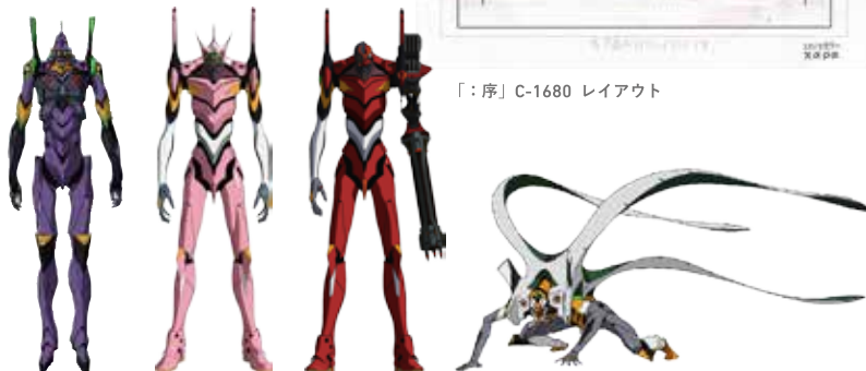
左から「：Q」エヴァンゲリオン第13号機 色設定 / 「：Q」EVANGELION Mark.09 色設定 / 「：Q」汎用ヒト型 決戦兵器 人造人間エヴァンゲリオン 正規実用型 改2号機β 3DCGモデル / 「：Q」汎用ヒト型決戦兵器 人造人間 エヴァンゲリオン 正規実用型（ヴィレカスタム）8号機α 3DCGモデル