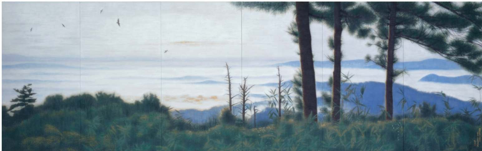
平山郁夫『八雲立つ 出雲路古代幻想』1998年 平山郁夫シルクロード美術館蔵

広島県瀬戸田町(現尾道市)生まれ。東京美術学校(現東京藝術大学)日本画科卒業。東京藝術大学美術学部教授・学部長・学長を歴任。ユネスコ親善大使を務める一方で、創作活動に従事。1998年文化勲章受章。